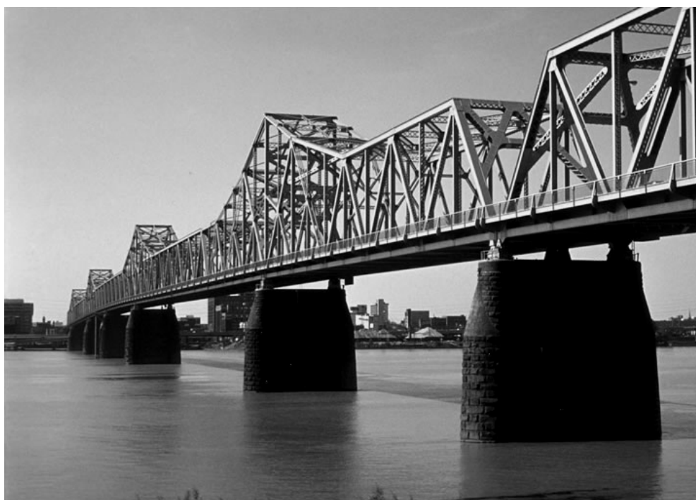
Brúin yfir Ohioána